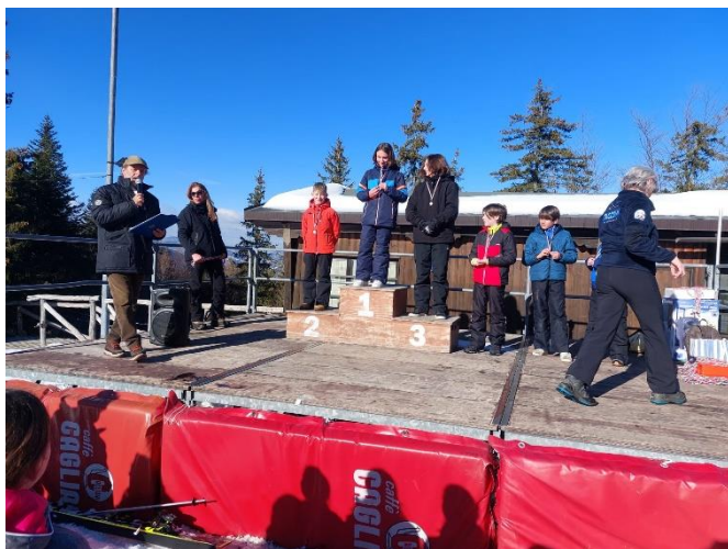
Alcuni momenti delle premiazioni