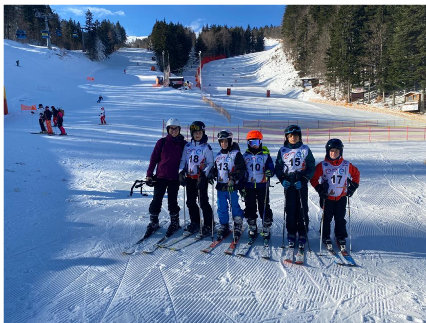
Una delle rappresentative scolastiche in gara

Si sono svolte sulle nevi dell'Abetone (PT) le fasi prov.li dei Campionati Studenteschi di Sci Alpino